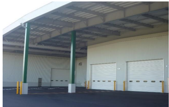
トラックヤード 屋根下 15~12m