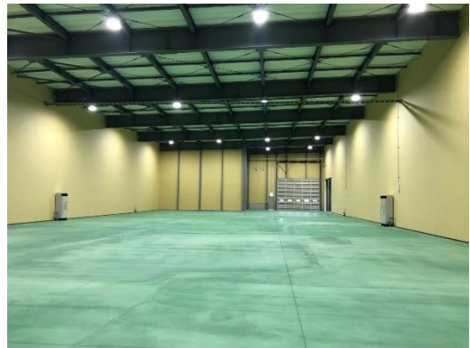
LED 照明を導入した倉庫屋内