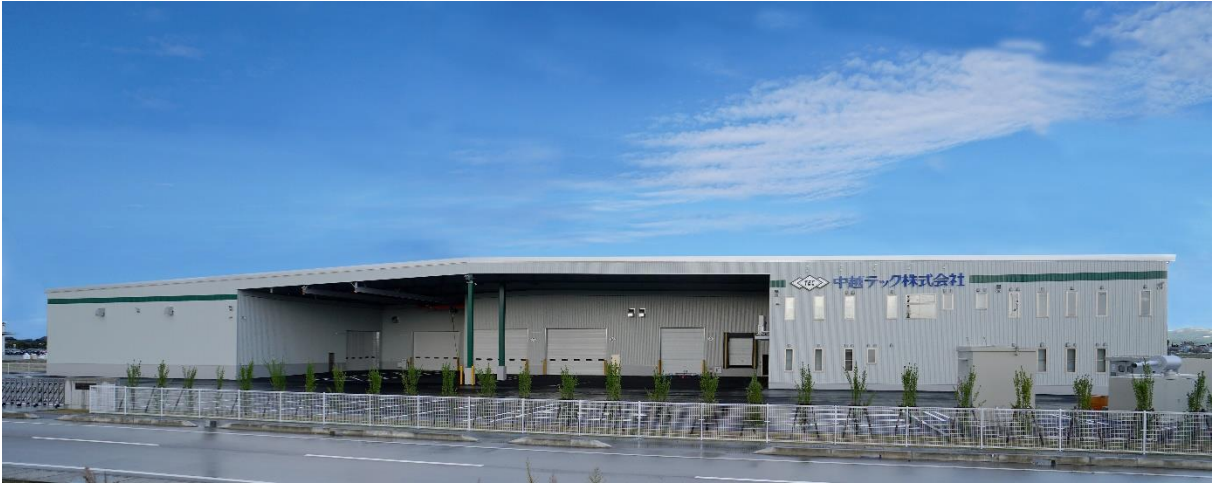
第2物流センター 外観