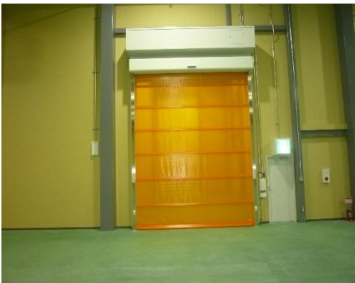
高速ロールシャッター 屋外から異物混入を最小限に抑える